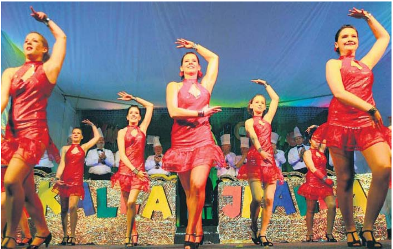
Mit ihrem Showtanz Carnaval Brazil entführten die Gardemädchen die Frühschoppengäste in wärmer Gefilde.